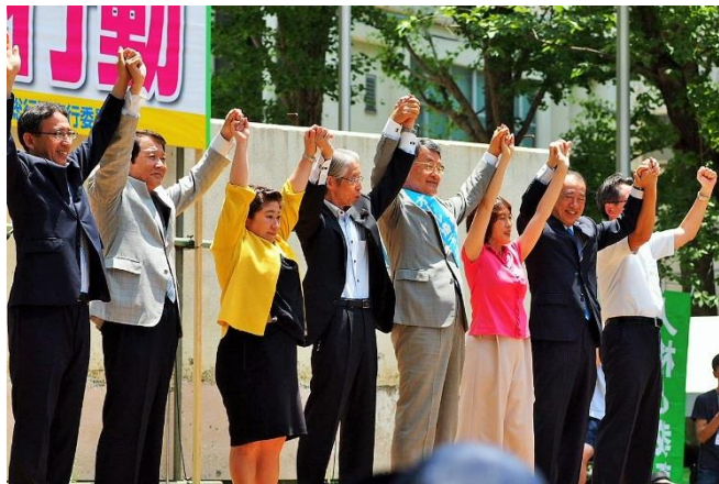
野党全党集合しました