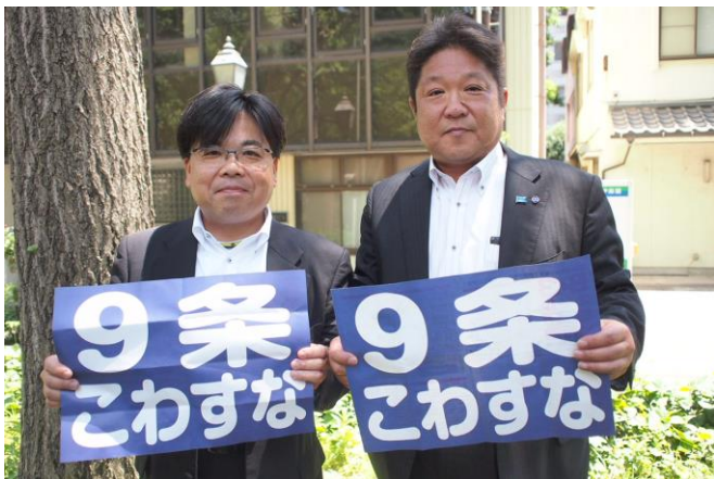
埼労連（左）と連合埼玉が一緒に行動