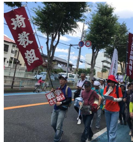
南与野駅までパレード