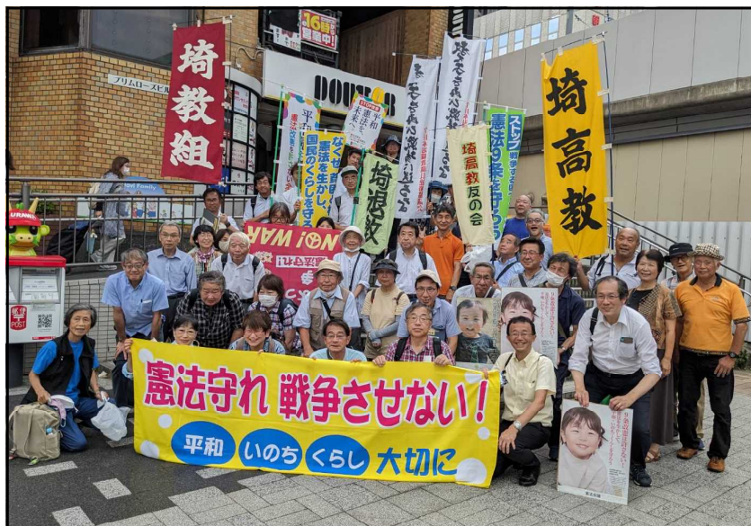
▲7/13「平和大会」浦和駅にて

第1分科会では、今年度もこれまでに次々とくり返されてきたさいたま市の トップダウン施策 に揺れる学校現場の状況について話し合います。国内最大規模の「 義務教育学校 」の動き、子どもたちの個人情報 が海外に流出したリクルート社のスタディサプリ のこと等話題満載ですが、参加者のみなさんと深めていきます。また、年々政治の 不当介入が心配されてきた教科書問題 についてレポート報告があります。戦争を賛美するような 中学校歴史教科書の検定合格もある中で、ますます強まる教科書会社への不当な圧力と自主規制の実態 と今年度のさいたま市の 中学校教科書の採択会議の様子 について報告します。