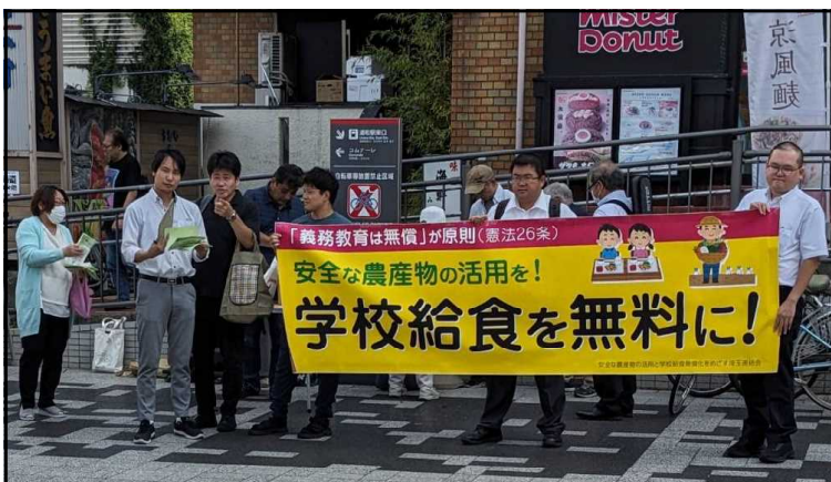
9.6「給食無償化宣伝行動」浦和駅前にて

※感染症の流行の状況によっては、防止対策として出入口で検温・手指の消毒を行います。また、マスク着用をお願いすることがあります。その際にご協力をお願いします。