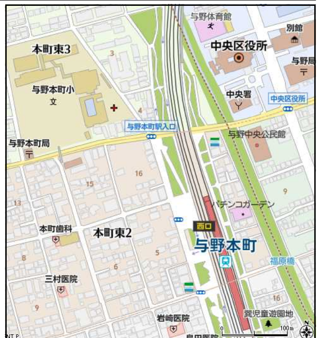
▲【会場は与野本町駅から徒歩約3分です】